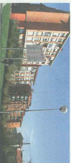
La sentencia no impide el desarrollo urbanístico de la zona

El Consistorio deberá volver a realizar, de nuevo, todos los trámites administrativos