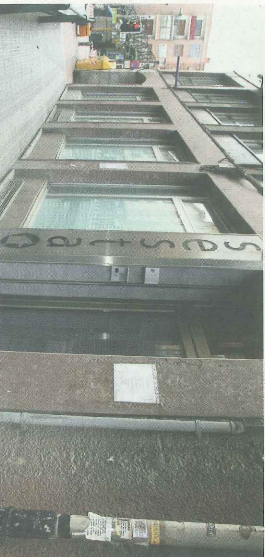
Hasta ahora, Sestao Berri ha realojado a 99 familias