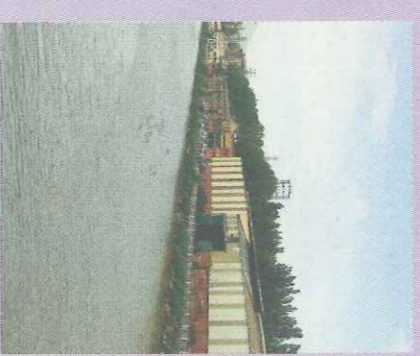
Acaban las obras de descontaminación

Los trámites administrativos retrasan hasta 2011 la edificación de 328 viviendas